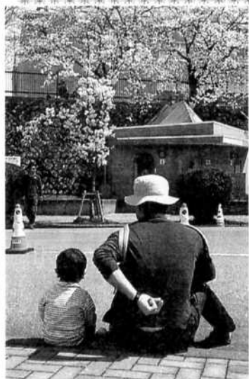
お父さん!! きれいだよ!!