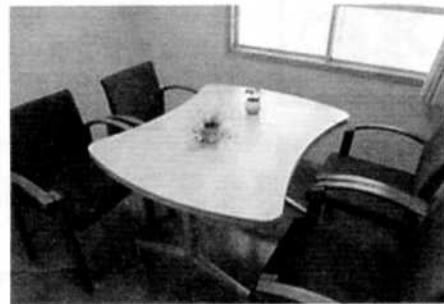
鑑別所相談室 ここで相談します

なお、入所者に目を転じると、中学や高校に在学中の少年や、当所入所前から様々な機関の支援を受けていた少年が少なくありません。お世話になった学校や関係機関の先生方の面会は、彼らにとって大きな励みになり、内省を深める契機にもなっています。また、社会での彼らの様子等について情報提供いただくことは、鑑別・観護処遇の質を高めることにつながっています。地域援助はもとより、少年鑑別所に入所した少年、さらには、少年鑑別所や少年院から社会に戻っていく少年の支援にも、皆様のより一層のお力添えをいただければと思います。よろしくお願ひします。