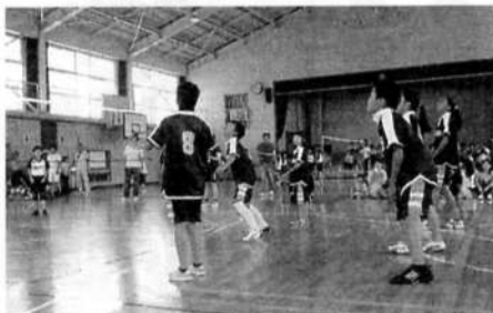
子ども会球技大会(ソフトバレーボール)