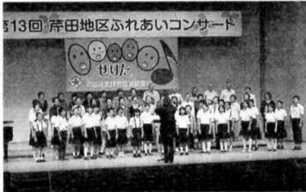
芹田地区ふれあいコンサート

更に芹田特別ルールを設けて低学年の子どもも楽しめる内容としました。昨年の大会では、14チームが参加し、熱戦を繰り広げました。芹田の全地区が参加する大会にする為に創意工夫を重ねていきたいと思っております。